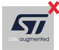
タグラインの色変更は不可