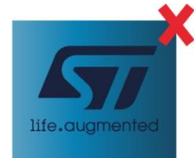
グラデーション背景に配置など、識別を損なう表示は不可